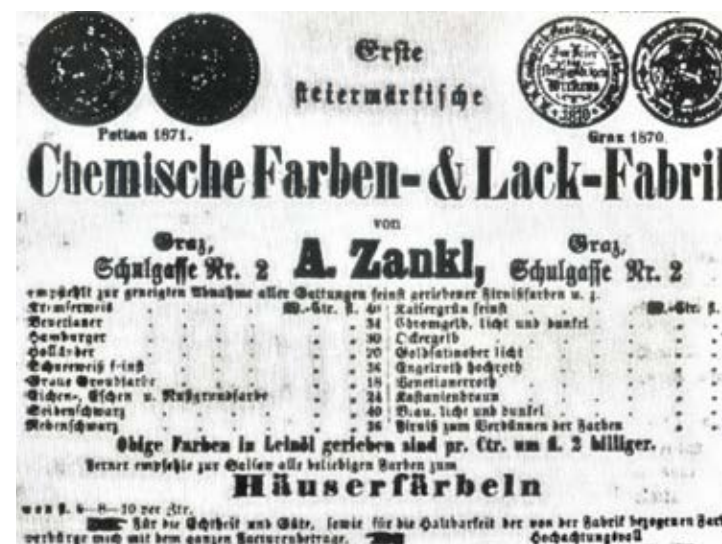
1872 wirbt „A. Zankl“ in der Grazer Tagespost für ihre Produkte, besonders für Hausfarben.