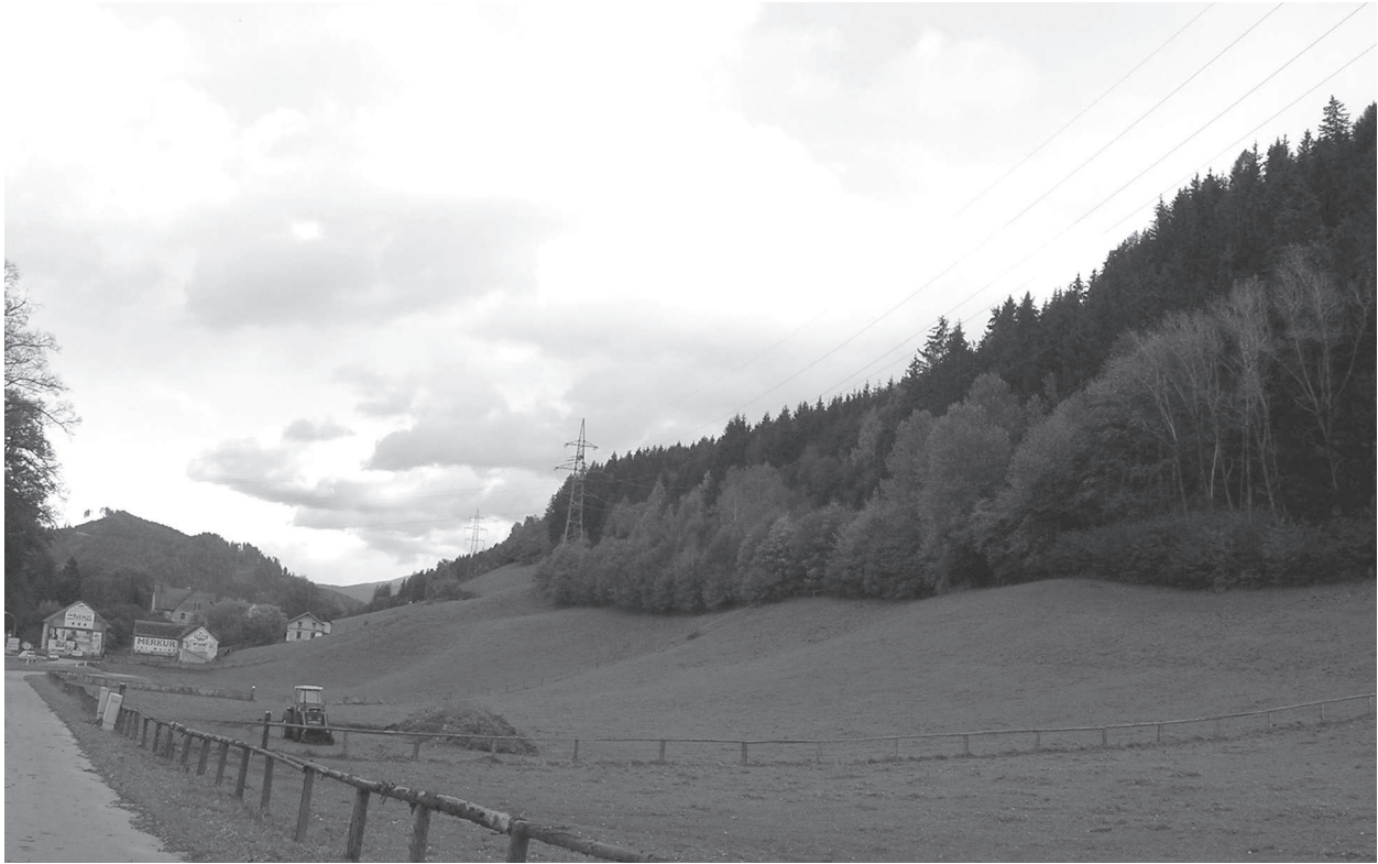
Abb. 4: Das Gefechtsfeld heute

schiehenden Franzosen) sieht man, wie sich die Landwehr auf den Anhöhen (re.) versammeln konnte und auf die Franzosen hinab feuern konnte. 25