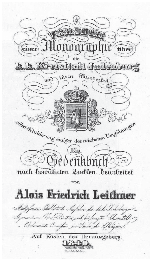
Abb. 1: Deckblatt von Alois F. Leithners Monographie über die k.k. Kreisstadt Judenburg, 1840

Und dann, am 13. Oktober 1807, hatte sich der größte Stadtbrand Judenburgs ereignet. In der Burgkaserne war der Brand ausgebrochen, hatte sich über beide Hauptstraßen bis zum Ostrand der Stadt und den Häusern am Landtorberg ausgebreitet und zwölf Stunden gedauert. 143 Häuser, sämtliche Kirchen und Klöster im Zentrum der Stadt waren erfasst worden. Stadtturm, Stadtpfarrkirche, Franziskanerkloster und die Jesuitenkaserne samt den umliegenden Häusern waren teils bis in die Keller zerstört worden, fünf Menschenleben waren zu beklagen. 8 Die Stadt lag, so Andritsch, „bettelarm“ da. 9