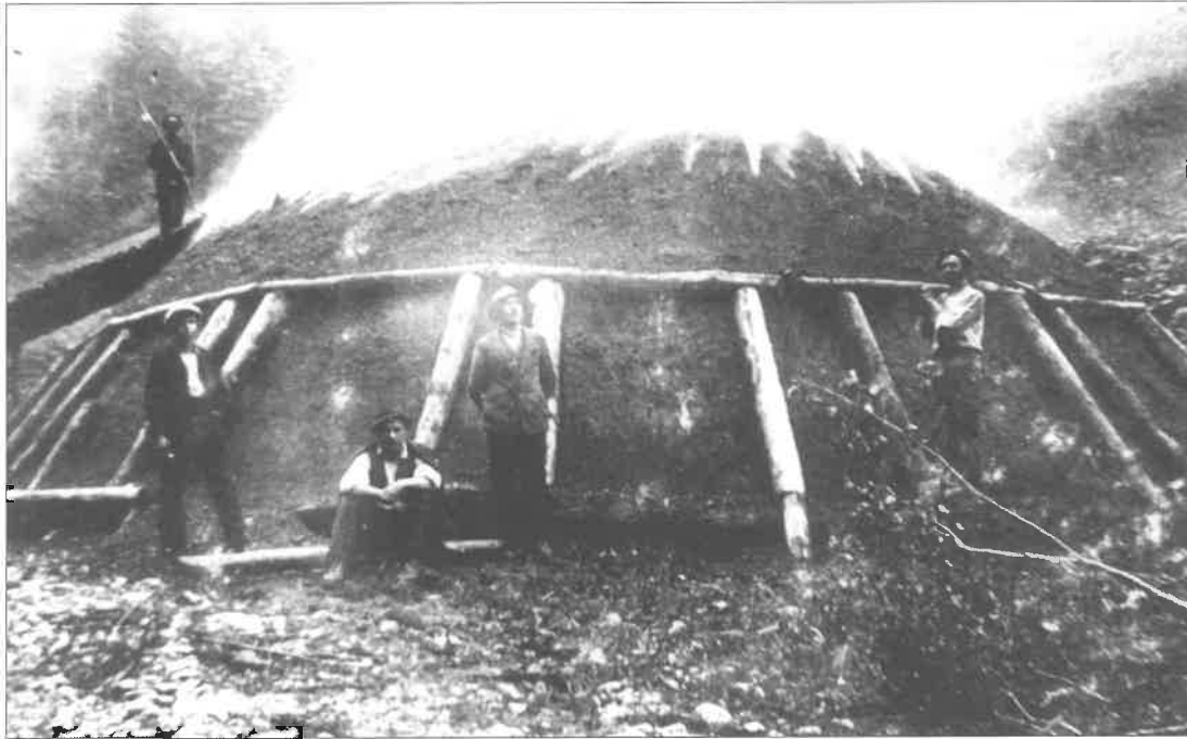
Köhlerei Hartelsgraben, um 1900

In historischen Querverweisen wird hin und wieder mit der allgemeinen Waldgeschichte der Steiermark verglichen. Als „Brennpunkt“ – angesichts des Hieflauer Rechens mit den glühenden Kohlenmeilern im wahrsten Sinne des Wortes zu verstehen – eignet sich die enge Fokussierung auf wenige Hektar am besten. Ist doch durch die ausgezeichnete Quellenlage eine sehr detaillierte Untersuchung bis zur Reviergröße möglich. Erst dadurch ist der exakte Zustand der Wälder im Gesäuse im Laufe der Jahrhunderte nachvollziehbar.